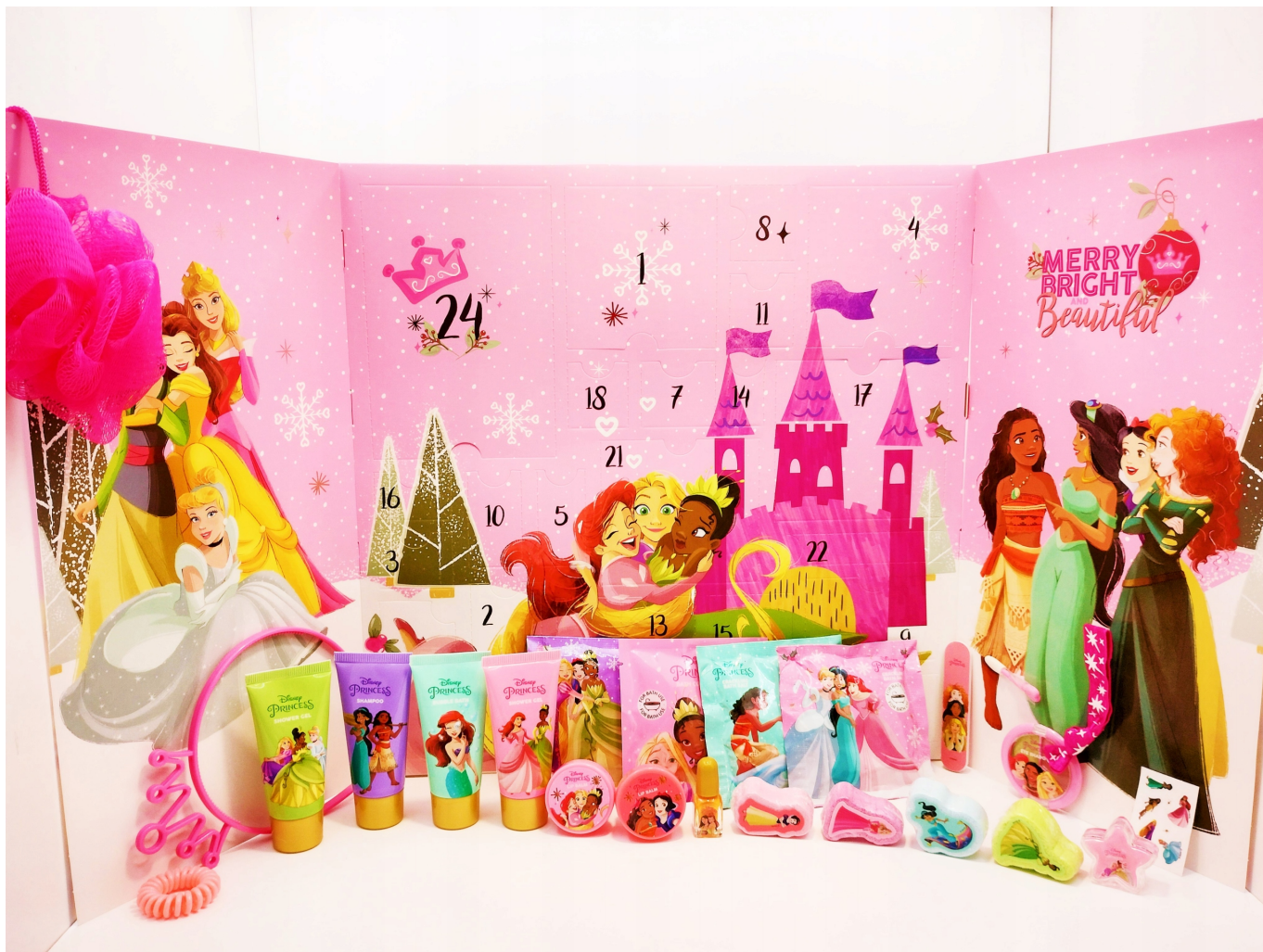
KALENDARZ ADWENTOWY Z KULAMI DO KĄPIELI